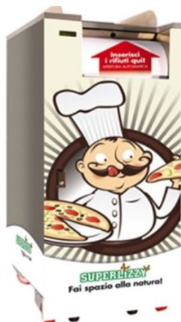
Superlizzy modell SL500-Full