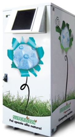
Superlizzy modell SL500-Freepass