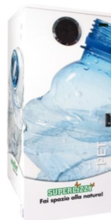
Superlizzy modell SL500-PET